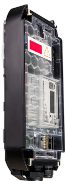
Wandmontage mit eClick

Die eBox smart/professional/touch kann mit folgenden Montage-Optionen eichrechtskonform ausgeführt werden: